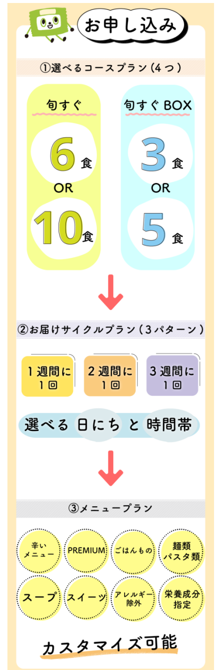
【お申し込みプラン】