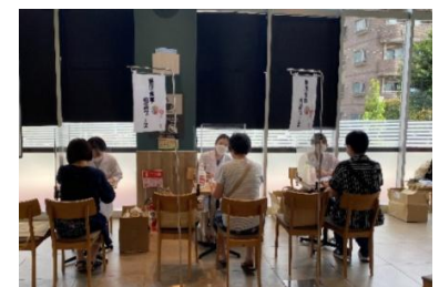
個別健康食事相談風景イメージ (写真は2022年9月イベント時のもの)