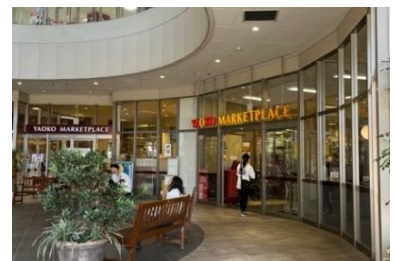
ヤオコー川越西口店 外観