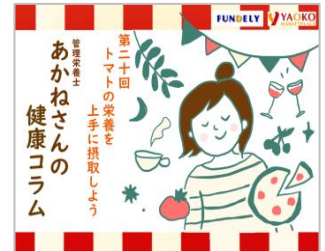
＜管理栄養士あかねさんの健康コラム＞ 「ヤオコーアプリ」で連載中